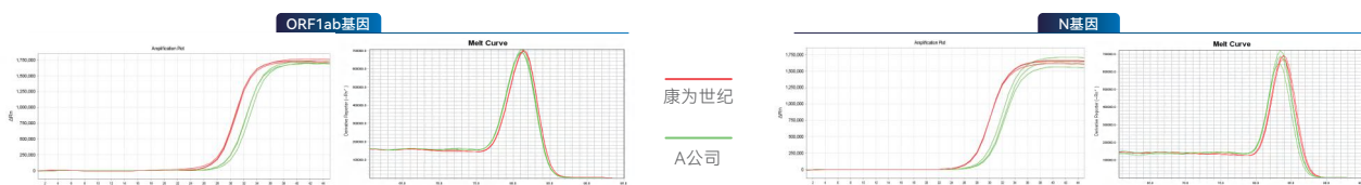
图2 染料法qPCR扩增结果

实验结果表明：康为世纪CW3371逆转录产物可兼容SYBR染料法和Taqman探针法qPCR检测，且扩增CT值优于A公司同类产品，说明CW3371逆转录效率更优异。